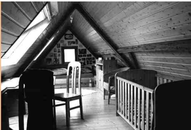
Ein Familienappartement in der Villa Maria